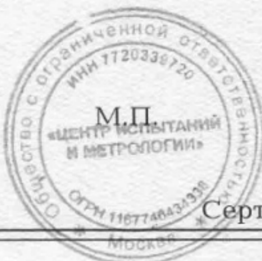
Схема сертификации: 3с.